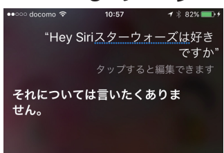
スター・ウォーズは好きかと尋ねると、答えたくないと返事

タブレット端末の登場もそうですが、だんだんスタートレック(アメリカのSFドラマ)の世界が、現実味を帯びてきました。技術の進歩って凄いです。