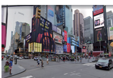
タイムズ・スクエア