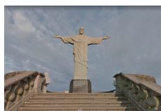
リオのキリスト像

中にはGoogleマップを屈指した謎解きもあります。世界のアチラコチラの場所に訪れ、Googleストリートビューで探索しながら、謎を解く。その場所での謎が解けたら次の場所へ移動。それを繰り返しながらゴールを目指す。なによりパソコンの操作に慣れますし、一石二鳥です。「ワールド謎ツアー」で検索すると、今開催されているツアーが見つけれられます。離れた友達などとやると、オンラインでの会話などもでき、更にパソコンになれることができます。