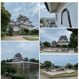
5枚をまとめたコラージュ

教室のWebページは左記アドレスから、スマホ・携帯からは、QRコードからどうぞ。新聞バックナンバーもご覧いただけます。